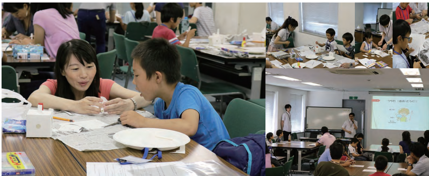
写真は過去開催分