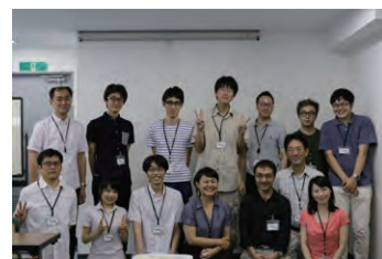
技術士と一緒に楽しく実験しよう！